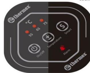
Panel de control estilizado